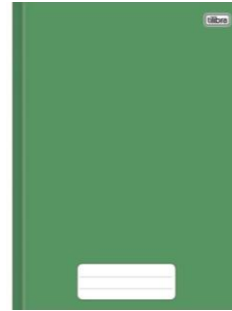
Caderno brochurão Capa Dura 40 ou 48 Folhas (vertical)