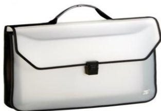
IMAGEM DA PASTA (em tamanho A4)